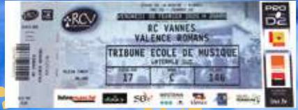
BILLET - Saison 2019-2020