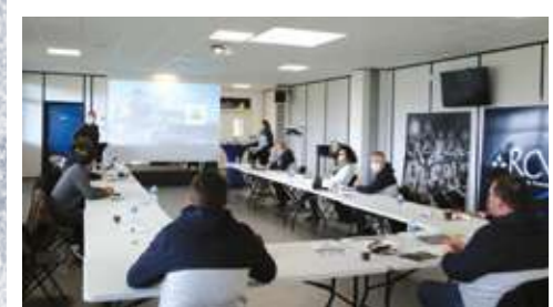
SÉMINAIRE LEROY MERLIN