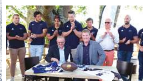
PARTENARIAT DAUCY - VANNES