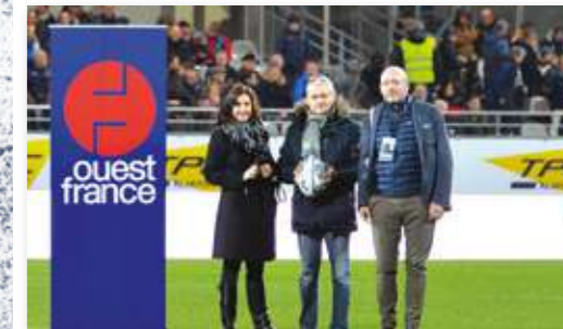
Parrainage de match OUEST FRANCE