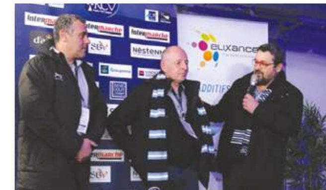
Interview lors du parrainage de match ELIXANCE