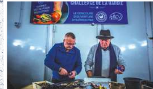
Parrainage de match LES VIVIERS DE BANASTÈRE