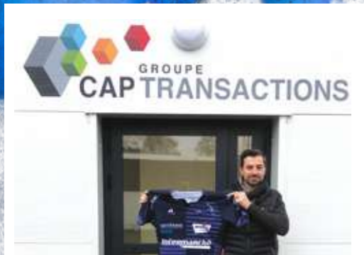
PARTENARIAT CAP TRANSACTION - VANNES