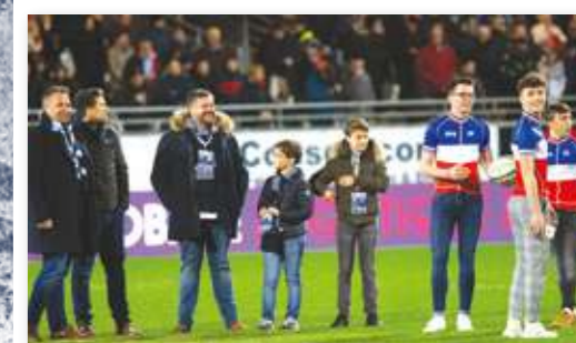
Parrainage de match TRANSPORTS DENOUL