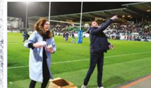
Parrainage de match DAUCY