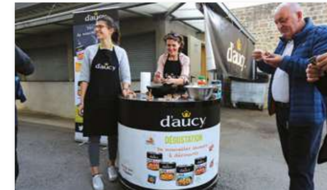
Dégustation DAUCY lors d'un match