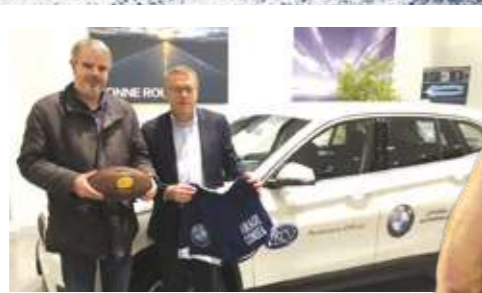
PARTENARIAT BMW - VANNES